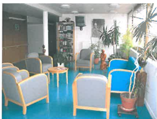
photo : Salon du 1 er étage

Un pédicure intervient régulièrement dans l'établissement ainsi que deux coiffeuses qui reçoivent dans un salon équipé les mardis (tous les 15 jours) et les jeudis, leurs tarifs sont affichés dans le hall d'accueil.