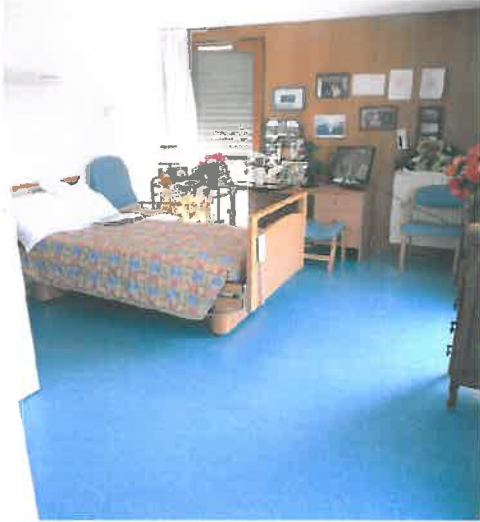
Les chambres sont personnalisables