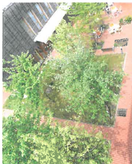
2 vues du jardin intérieur