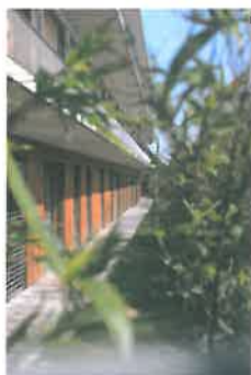
photo : vue arrière de l'établissement

A votre entrée dans l'établissement vous serez accueilli(e) par une infirmière, une aide-soignante et une auxiliaire de vie.